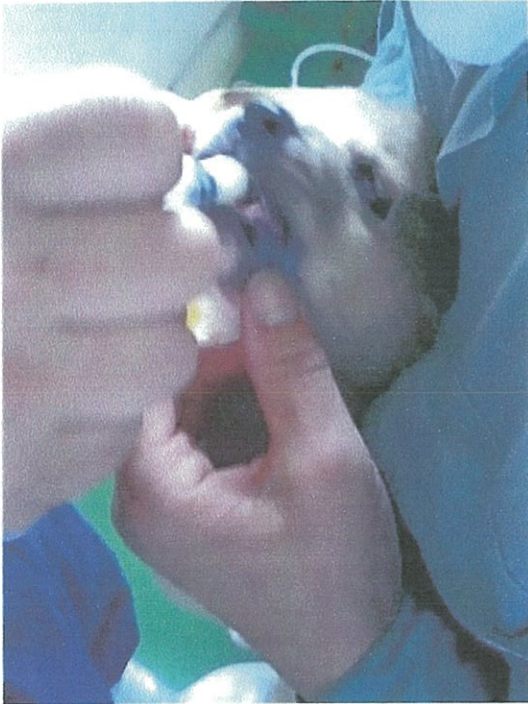
4カ月までの子犬には睡眠剤を 投与します