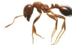
赤っぽくツヤツヤ