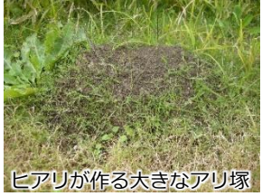
ヒアリが作る大きなアリ塚

外来生物法に基づく特定外来生物に指定されており、 生態系、農林水産業、人体への被害 が懸念されている。