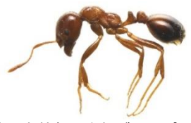
全体は赤茶色で腹部が黒っぽい赤色

南米原産のアリ。刺されるとやけどのような激しい痛みが生じる。体長は2.5mm～6mm。