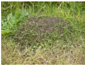
ヒアリが作る大きなアリ塚