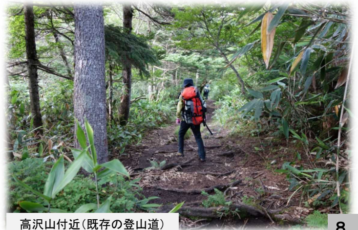
高沢山付近(既存の登山道)