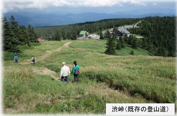
渋峠(既存の登山道)