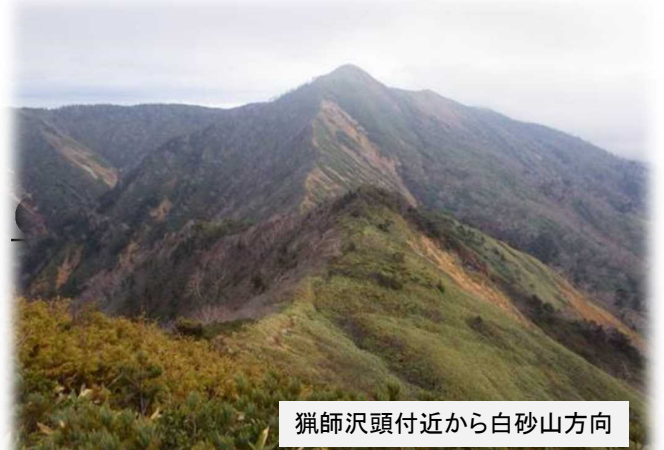
獺師沢頭付近から白砂山方向