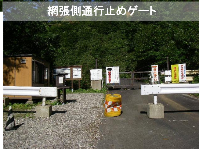
網張側通行止めゲート

起点・終点を結ぶ県道整備は平成8年から凍結されており、決定当初の利用は行われていない。