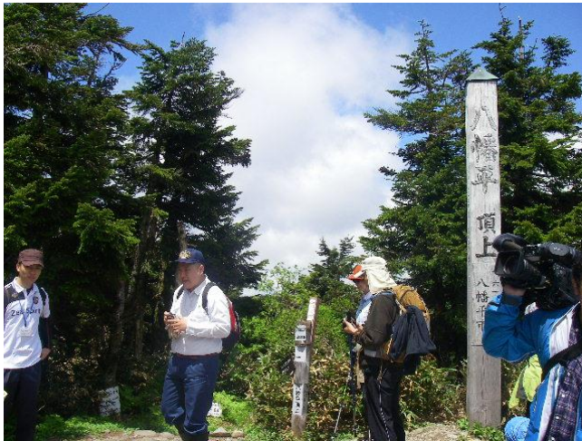
起点（八幡平頂上付近）