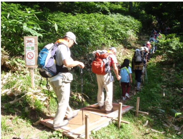
外来植物の侵入防止対策（環境省）