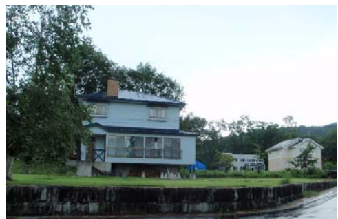
公園区域から削除するセツ森地区