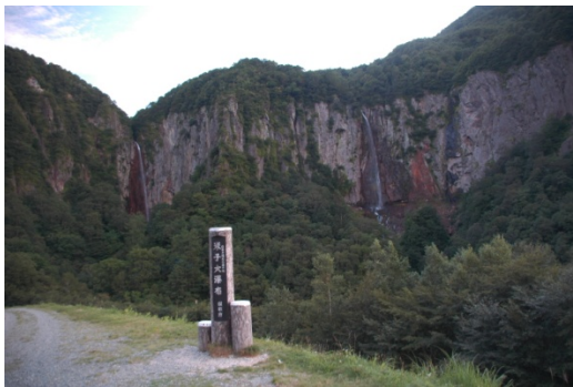
米子大瀑布 (普通地域→第2種特別地域)

特別地域 → 第2種特別地域 1,123ha 普通地域 → 第2種特別地域 452ha