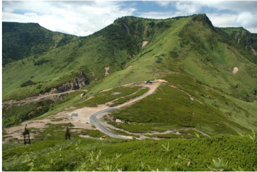
破風岳・毛無山 (普通地域→第1種特別地域)

特別地域 → 第1種特別地域 11ha 普通地域 → 第1種特別地域 213ha