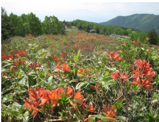
五味池破風高原 (普通地域→第2種特別地域)