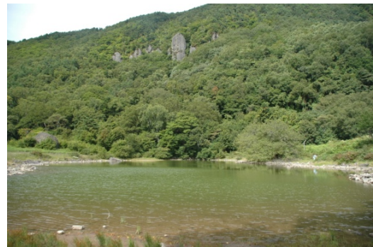
五味池 (普通地域→第2種特別地域)