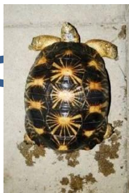
マダガスカルホシガメ