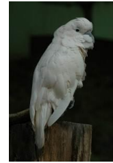
オオバタン