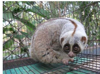
スローロリス