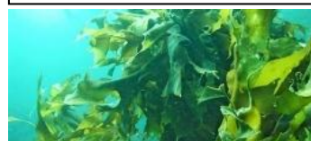
ワカメによる貝類養殖被害 (1980年代後半～ オーストラリア、北米大陸太平洋岸)