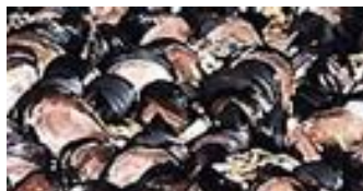
ゼブラガイによる発電所被害 (1989～2000 米国・五大湖)