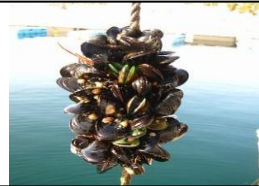
ムラサキガイによる漁業被害 (1970年代～ 日本・広島湾等)