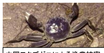
中国モクスガニによる漁業被害 (1910年代～ 欧州・ドイツ、バルト海)