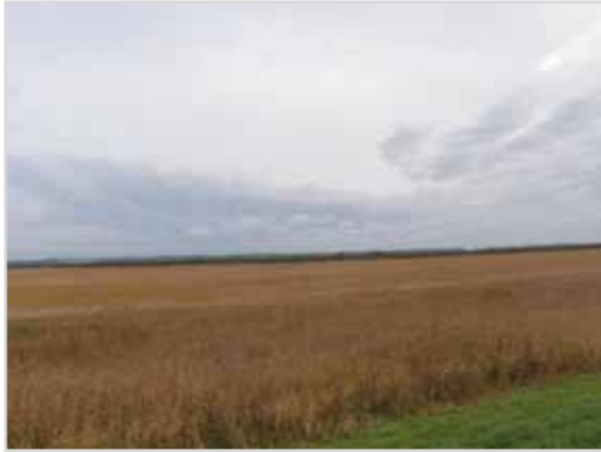
広里 (普通地域 第2種特別地域)