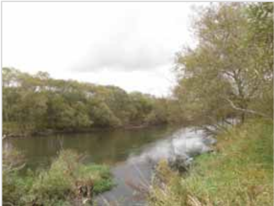
オソツベツ(オソベツ川流域) (普通地域 第2種特別地域)