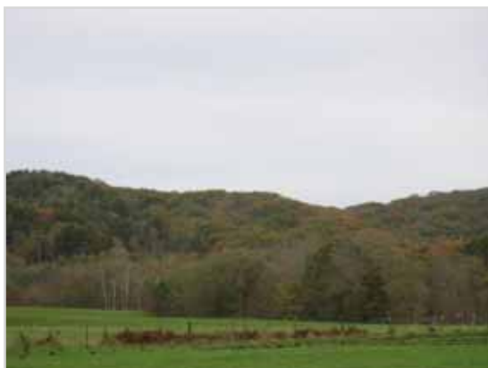
達古武川流域 (公園区域外 第3種特別地域)