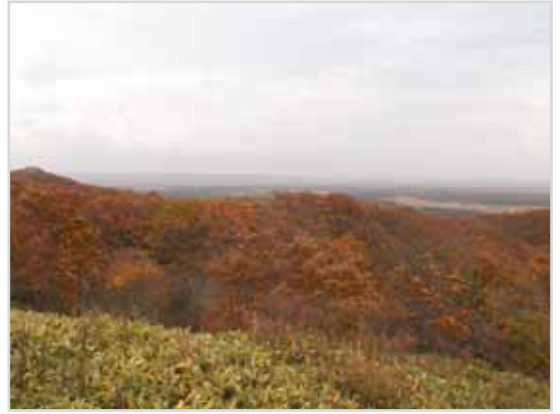
右岸堤防南 (第3種特別地域 第2種特別地域)