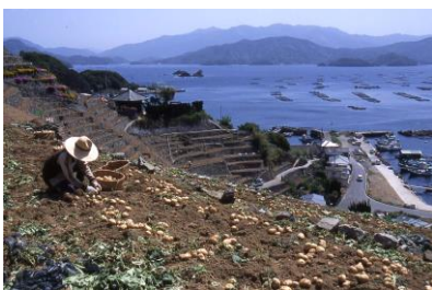
遊子水荷浦の段畑 (愛知県宇和島市)

国は、地方公共団体が行う、① 調査 、② 保存計画策定 、③ 整備 、④ 普及・啓発 の各事業に対して、原則として経費の2分の1を 補助 しています。