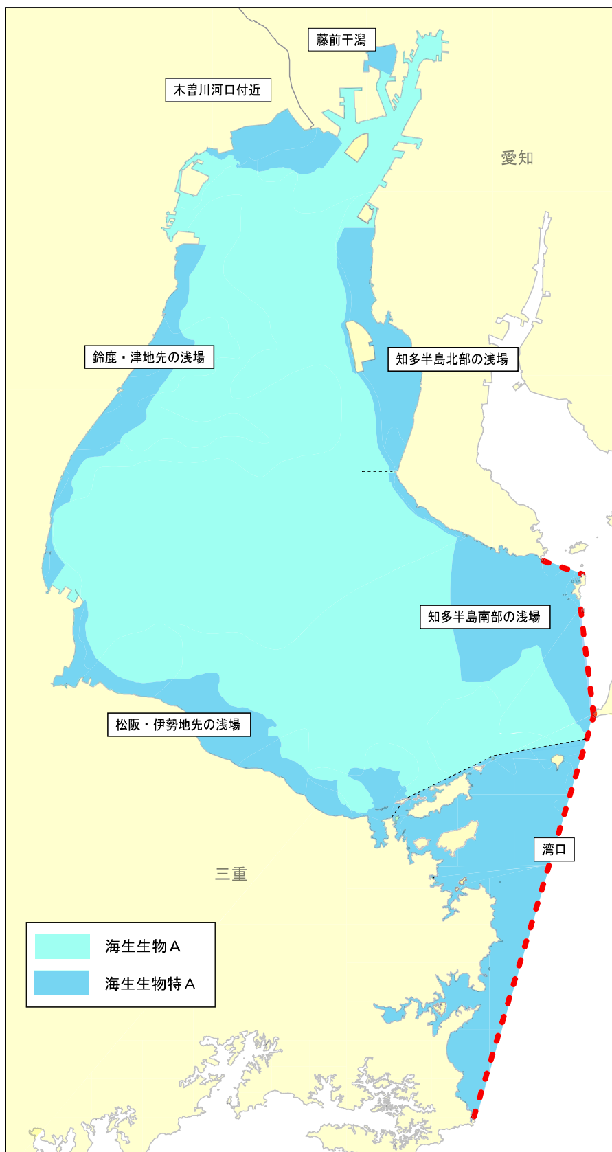
図 4-3 伊勢湾における特別域検討対象水域