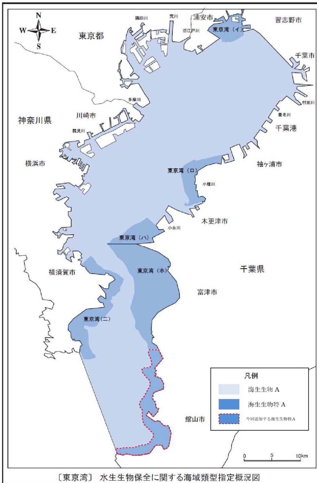
図 4-1 東京湾特別域検討対象水域