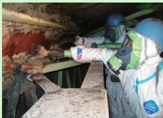
吹付け石綿の除去作業の様子