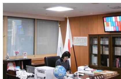
今年3月に環境大臣室にLED照明を導入