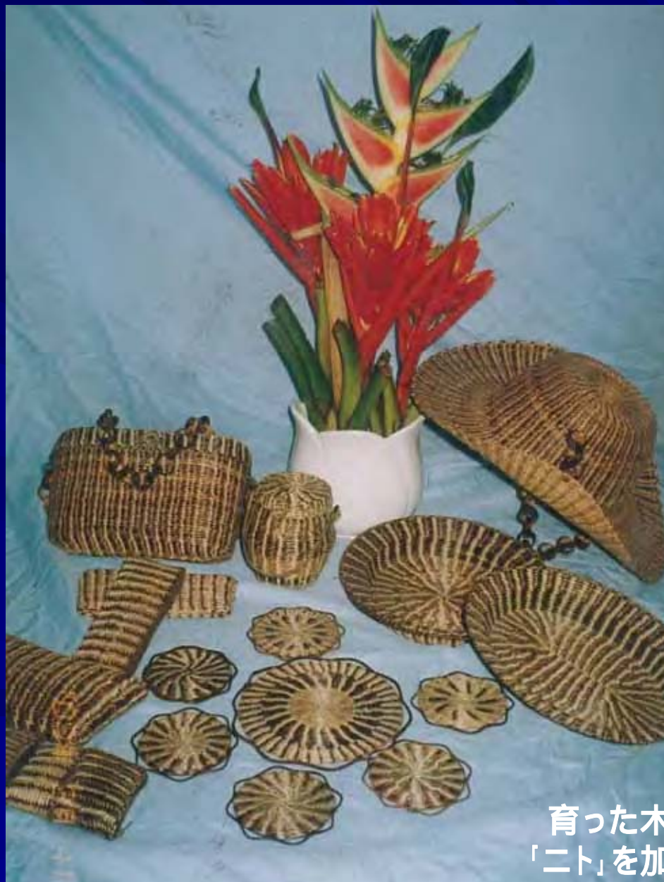
育った木々からまるツル植物 「ニト」を加工した工芸品