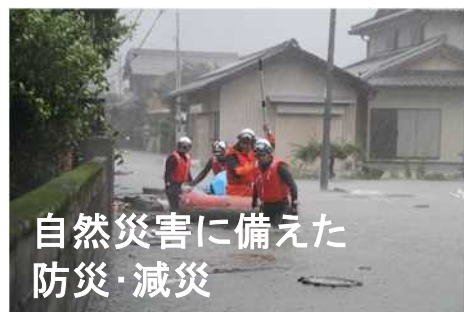
自然災害に備えた 防災・減災