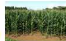
(成長早期化が期待される飼料用トウモロコシ)