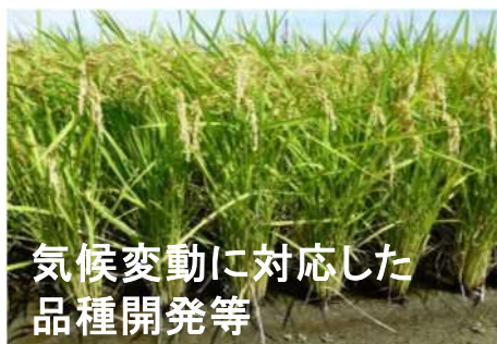
気候変動に対応した 品種開発等