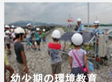
幼少期の環境教育