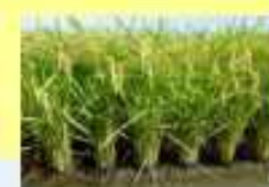
(高温耐性品種あきさかり)