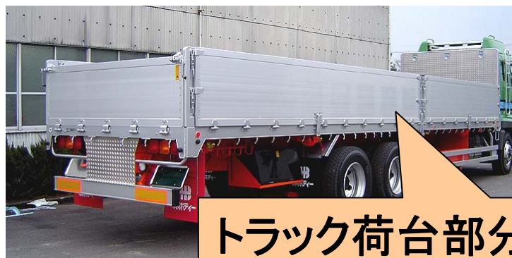
トラック荷台部分