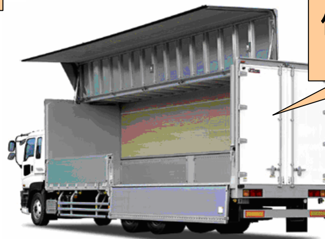
側面開放車 荷台部分