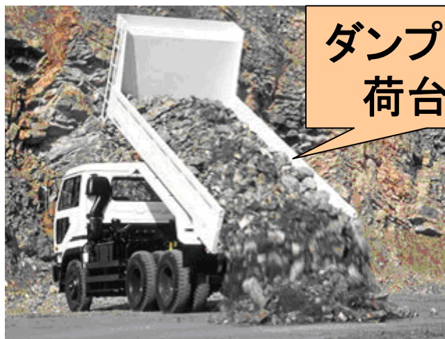
ダンプトラック 荷台部分