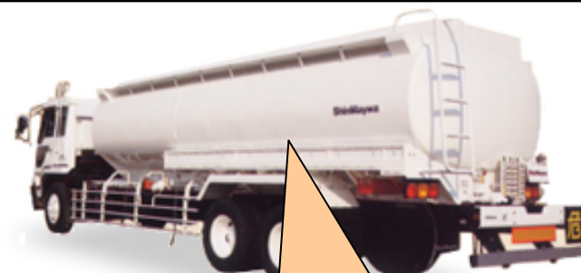
タンクトラック 荷台部分