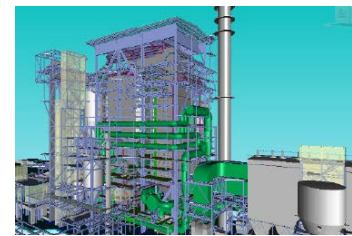
プロジェクトのイメージ