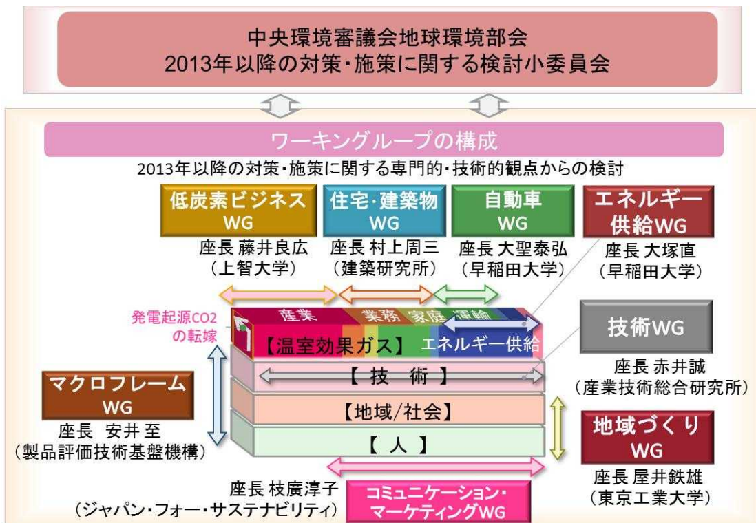
17 18 図表 8つのワーキンググループについて