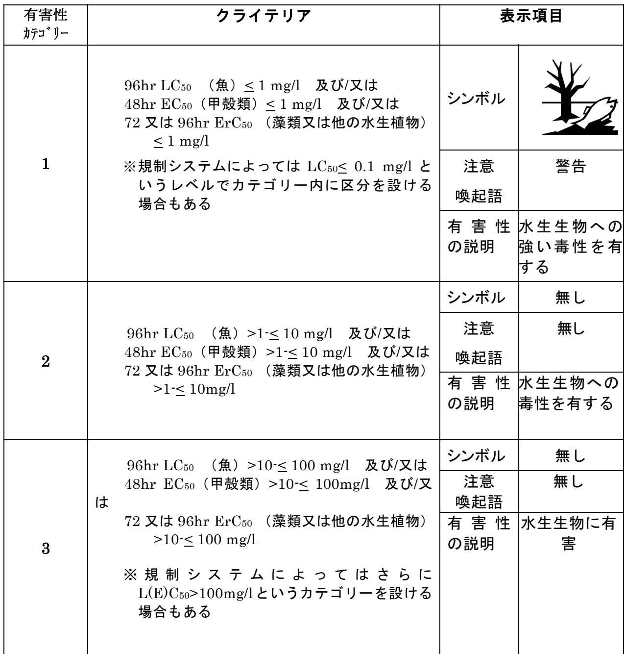
図 4. 1 水生環境 急性毒性