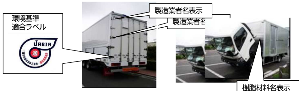
バン型車の表示例

2016年1月より、環境基準適合ラベルは、環境省ホームページ「環境ラベル等データベース」へ登録、掲載中。