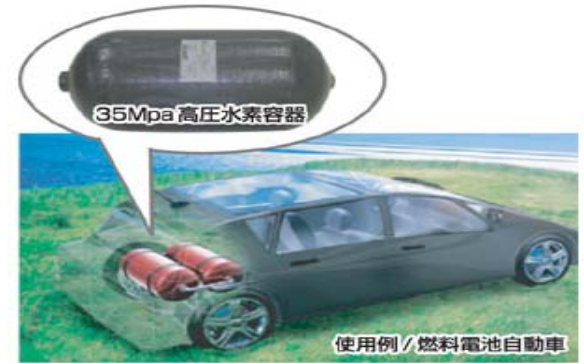
水素タンクにCFRPを使用した 燃料電池自動車