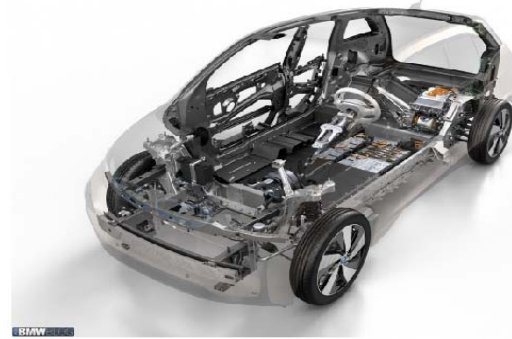
ボディにCFRPを使用した BMWの量産車(i3)