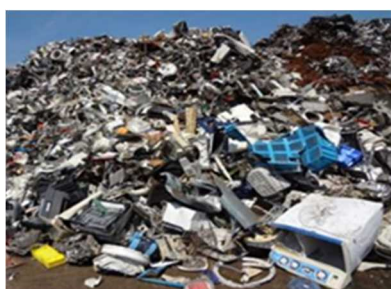
雑品スクラップの例

規制対象物は告示で規定されているが、パーゼル法に制定の根拠がないため、混合物を含め具体的な特定有害廃棄物等の範囲を明確な法的根拠に基づいて定めることができるようにする方策を検討すべきではないか。