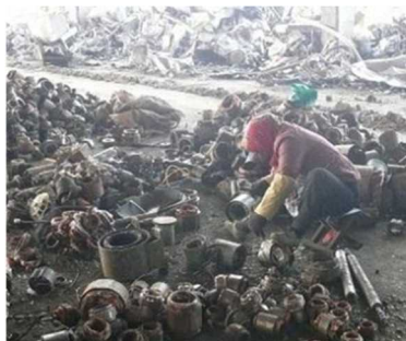
中国での金属スクラップ手解体 (2010年 国立環境研究所 寺園淳氏撮影)