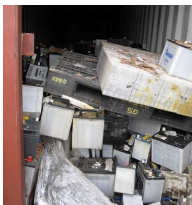
図6. 我が国に不法輸入された貨物の事例

バーゼル条約に基づいて、海外の輸出者の責任で我が国に不法に輸入された特定有害廃棄物等を我が国からシップバック(再輸出)しようとする場合について、我が国の輸入者が不当な不利益を被ることがないように、再輸出する際の承認を不要とするなどの方策について検討すべきではないか。