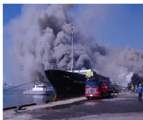
消火活動中の様子(平成24年10月)