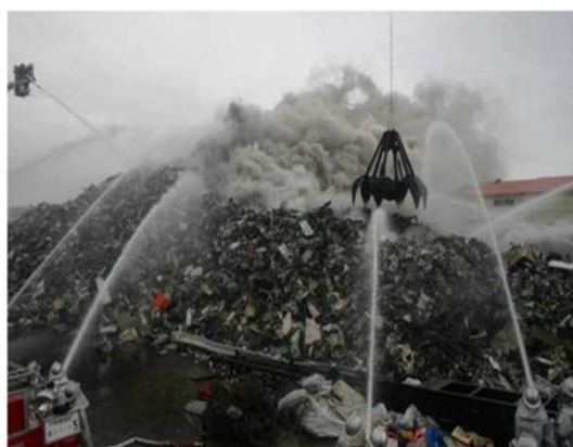
消火活動中の様子(平成20年4月)