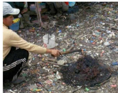
インドネシアでの被覆電線の野焼き