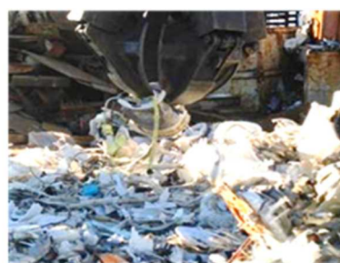
重機による洗濯機の破碎