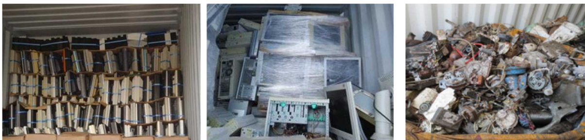
シップバックされた液晶ディスプレイ