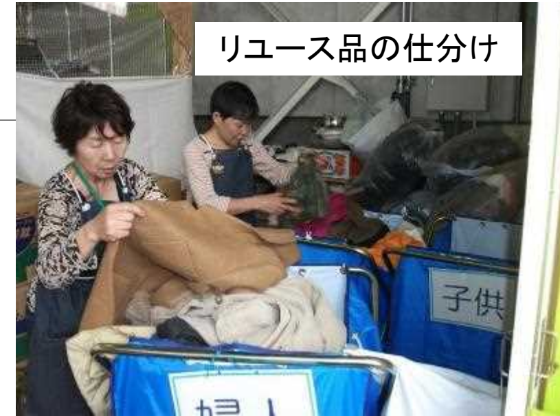
リユース品の仕分け