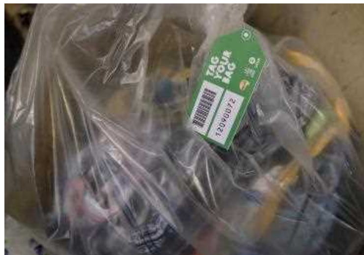
②寄付品にバーコード貼付