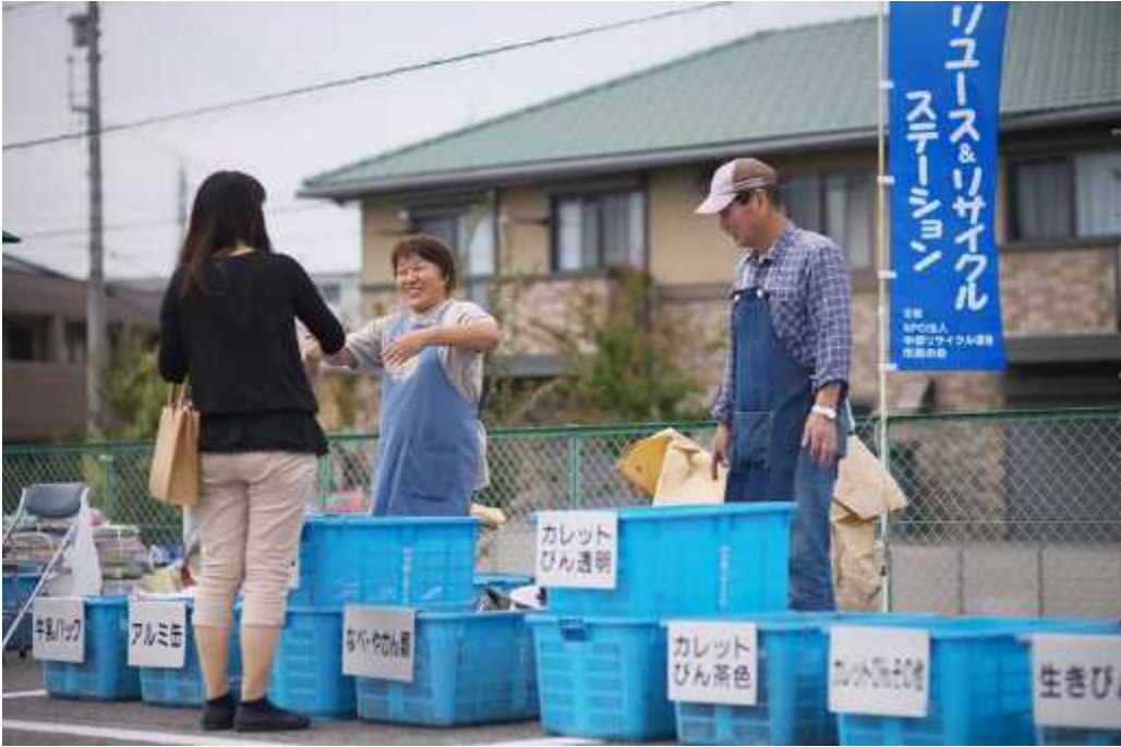
リユース&リサイクルステーション(38ヶ所)