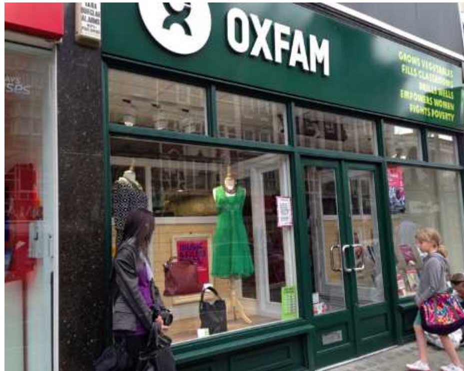
全英で10,000店を超えるCS