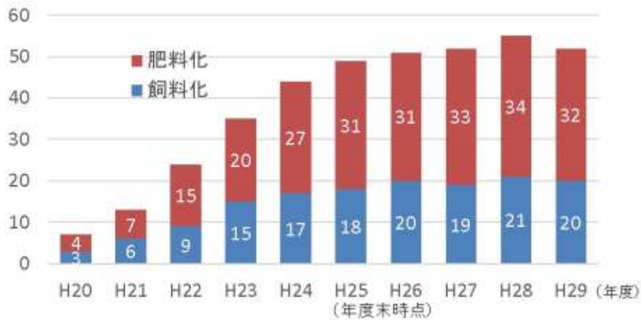
図3 再生利用事業計画認定数の推移