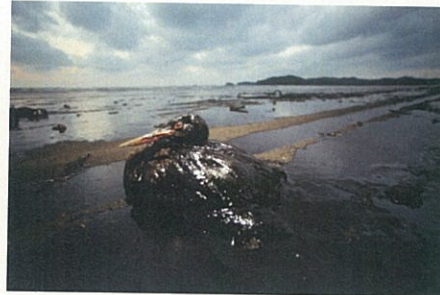
(左) http://www.enviroasia.info/news/news_detail.php3/K04111902J (右) http://www.enviroasia.info/news/news_detail.php3/K07120901J