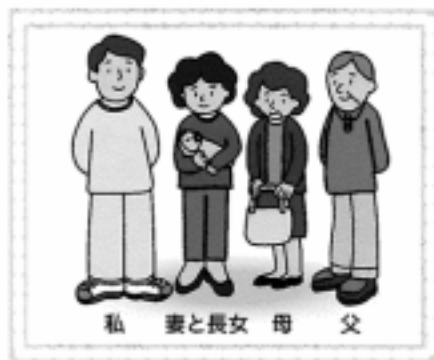
私 妻と長女 母 父

私は、10年後の福岡県のあるまちに住んでいる37歳の会社員です。36歳の妻、10歳の長女（小学校4年生）、7歳の長男（小学校2年生）、66歳の父、60歳の母と2世帯対応型の集合住宅で暮らしています。