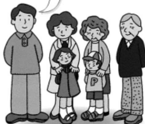
私 妻と長女 母と長男 父