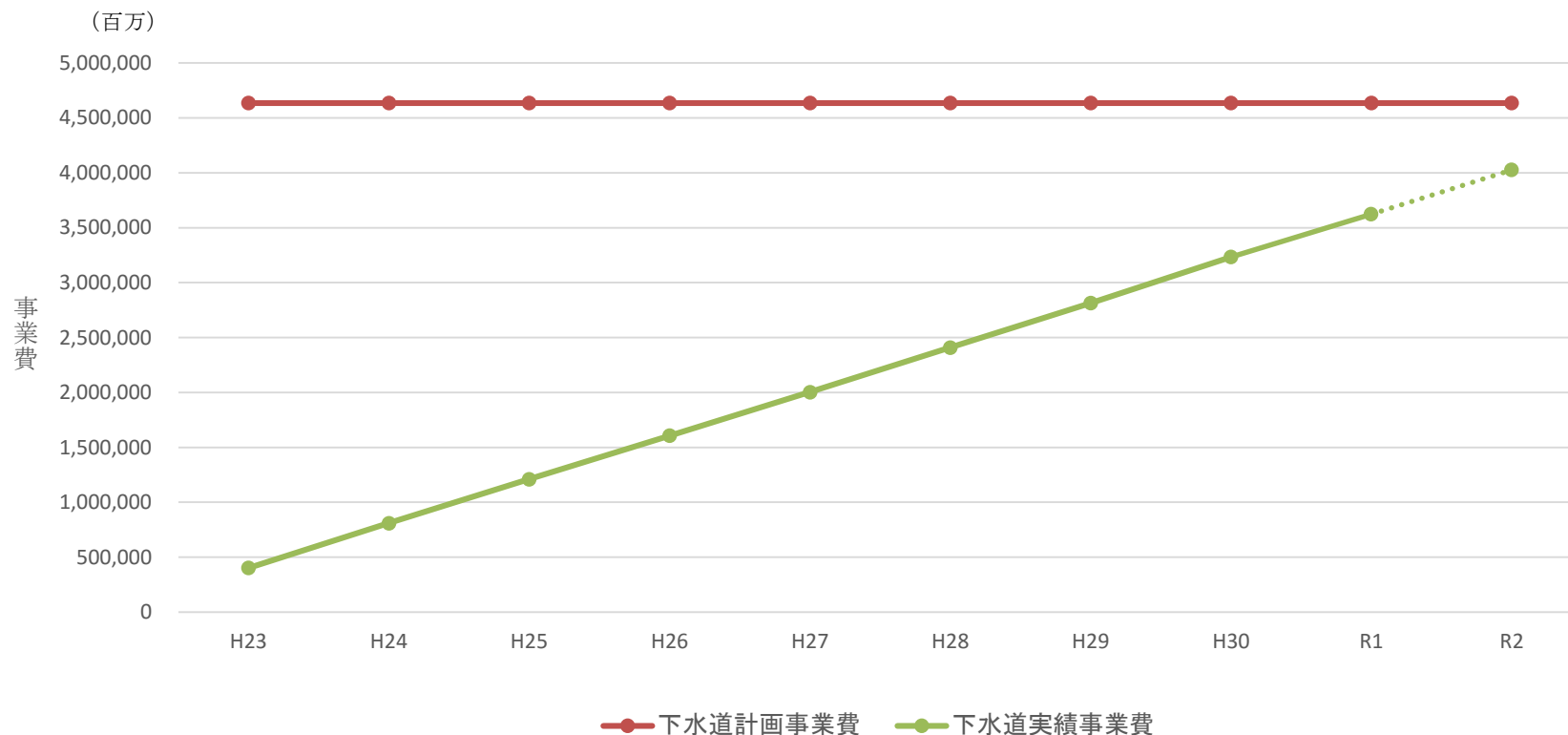
下水道事業の進捗状況