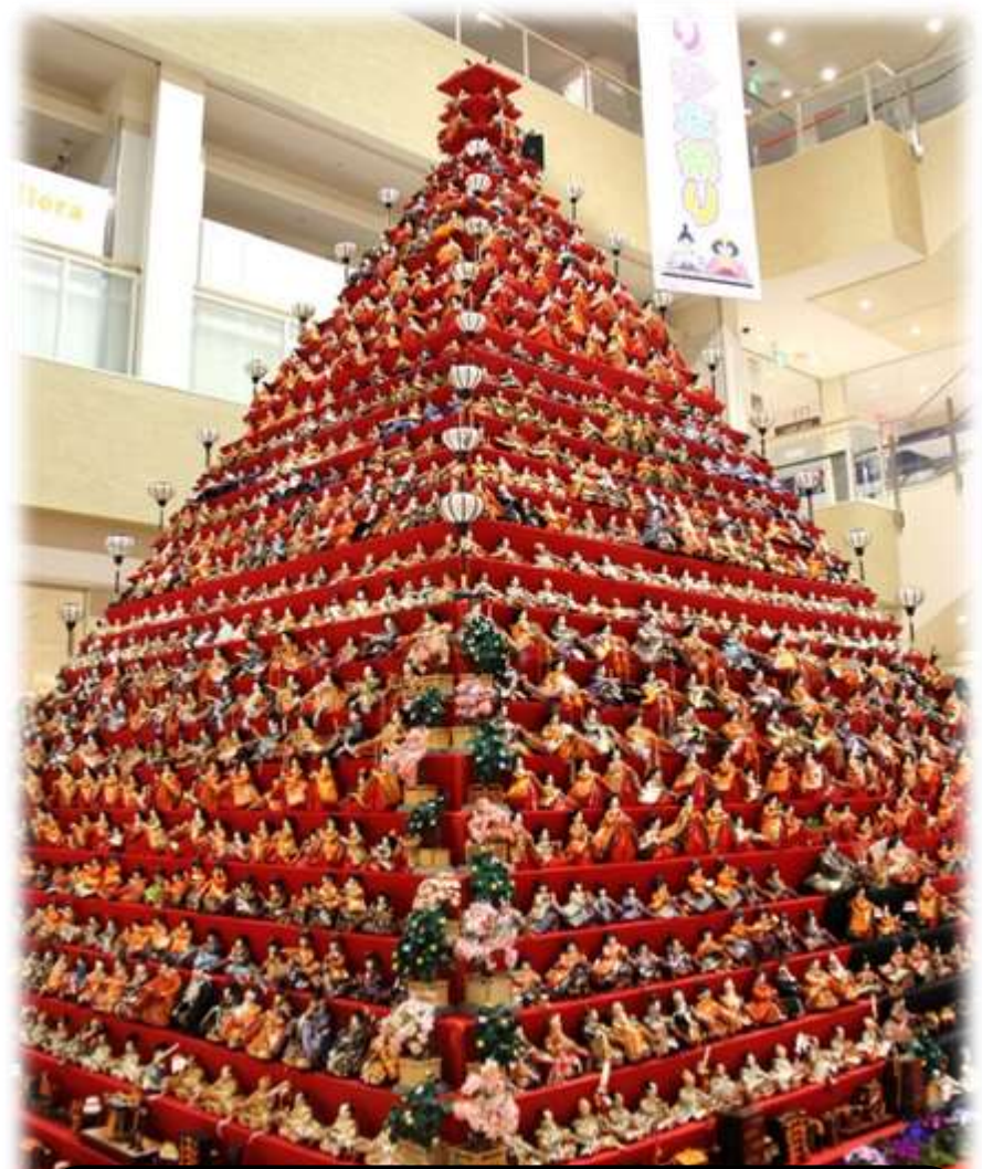
日本一のピラミッド型ひな壇