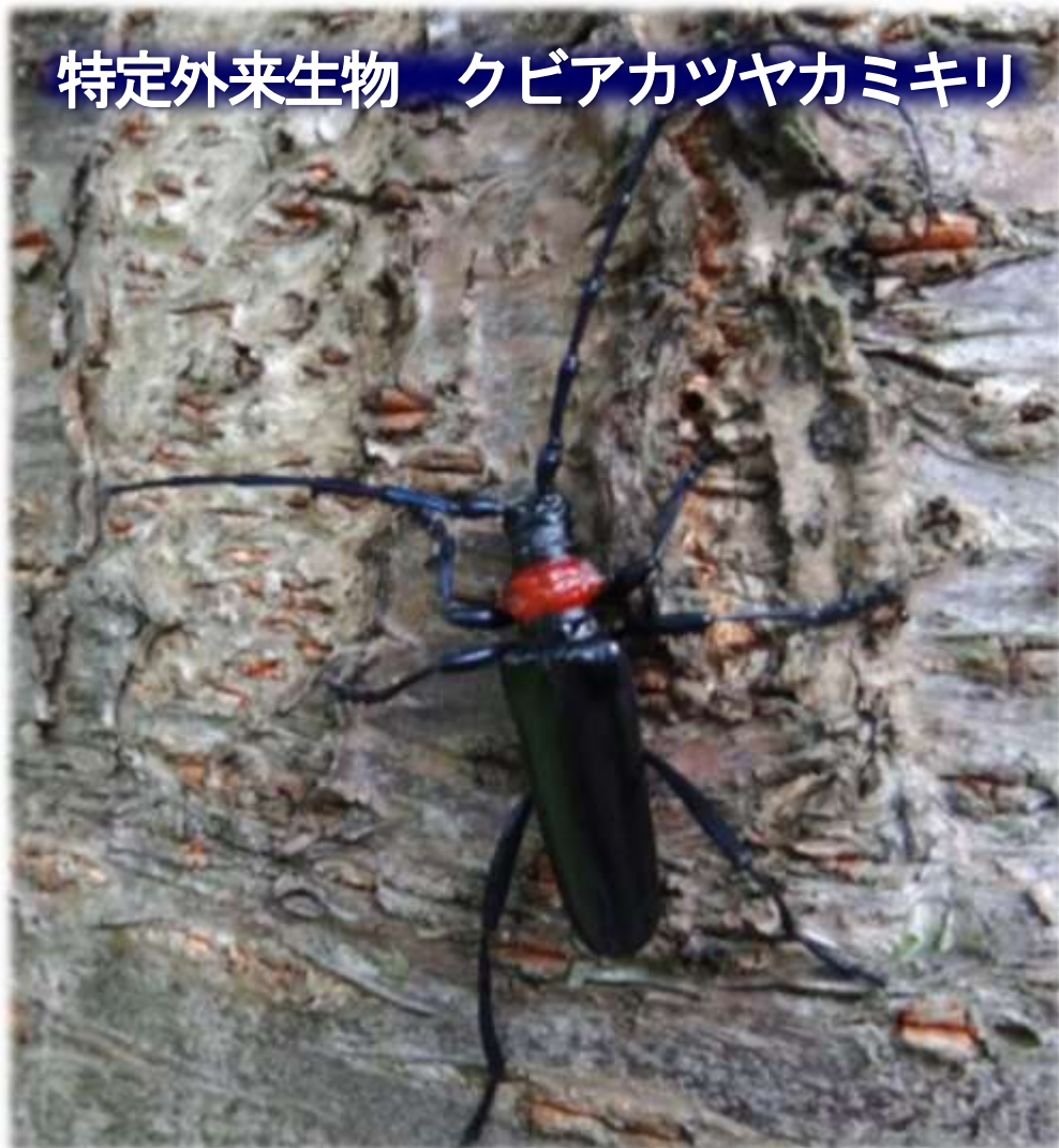
特定外来生物 クビアカツヤカミキリ