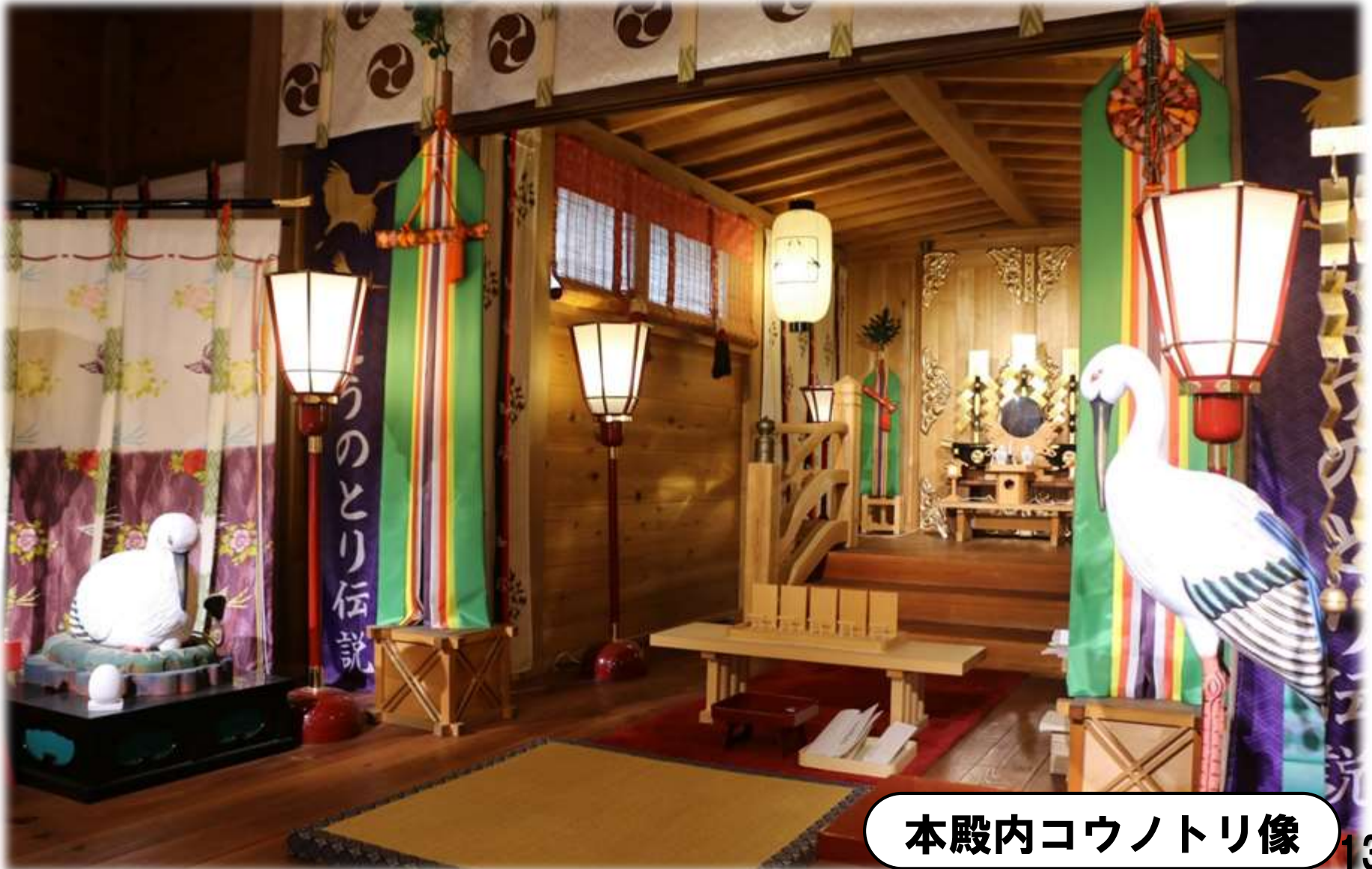
本殿内コウノトリ像