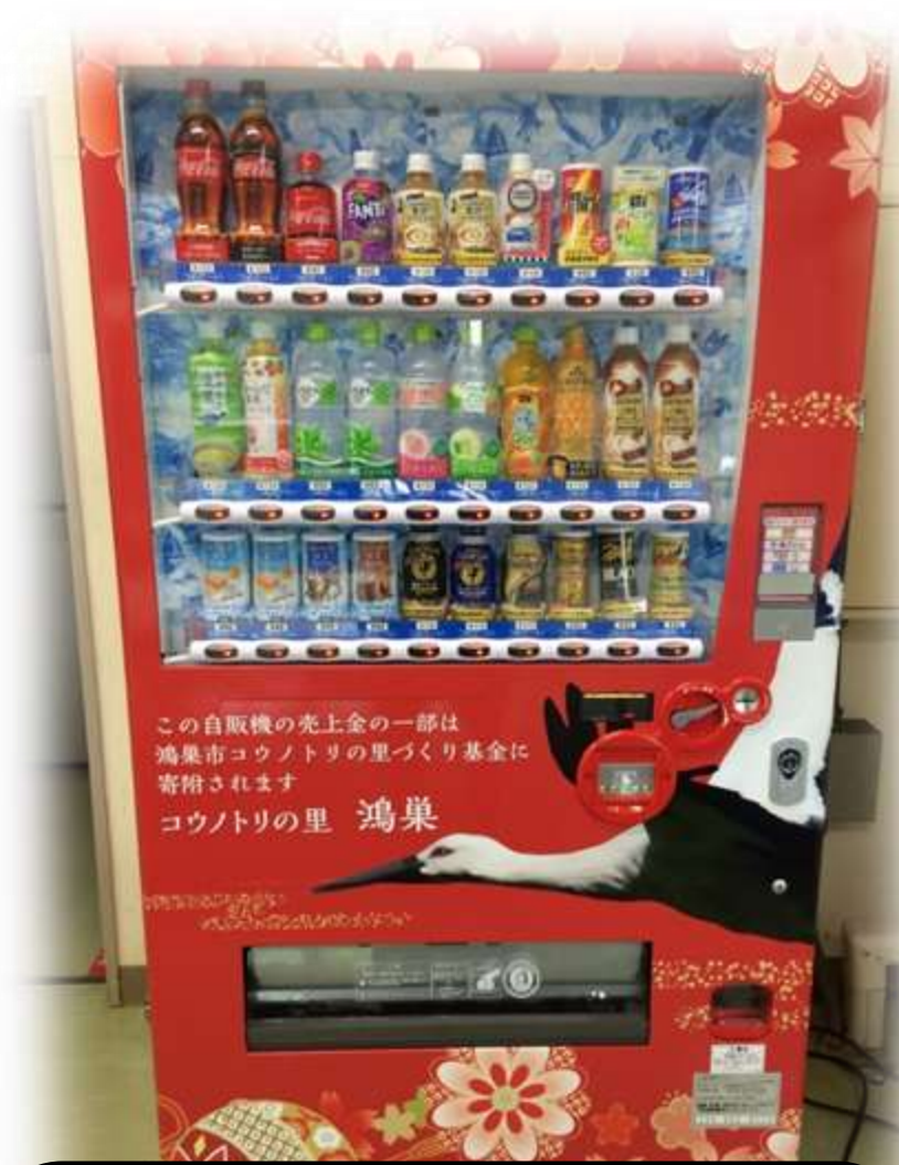
コウノトリがラッピングされた 支援自販機