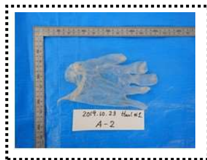
曳網番号 No. KG1023 2