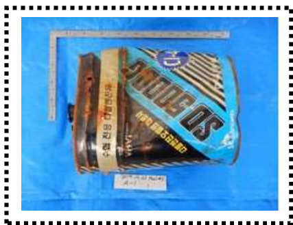
曳網番号 No. KG1023 1