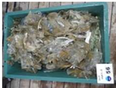
おしよろ丸で 2019.10.18 に採集された海底ごみ (破線内人工物)