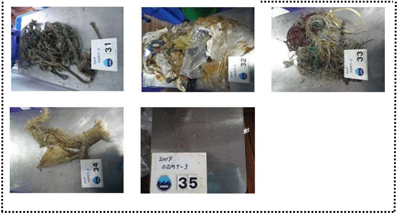
おしよろ丸で 2019.10.18 に採集された海底ごみ（破線内人工物）