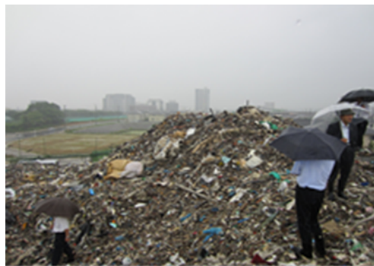
不法投棄等事案の確認の様子