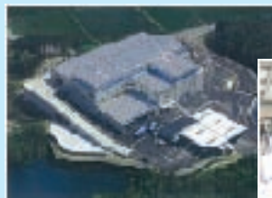
中継基地の設置導入事例