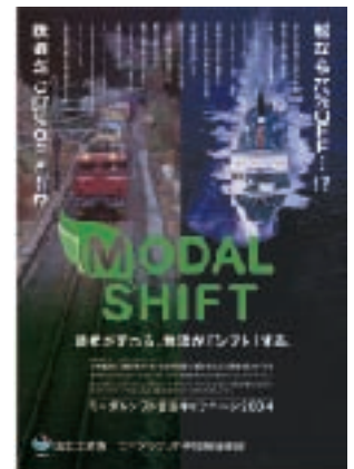
モーダルシフトのポスター (2004年/国土交通省)