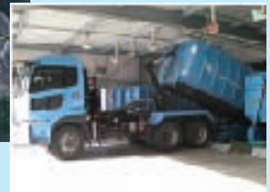
大型運搬車両導入事例