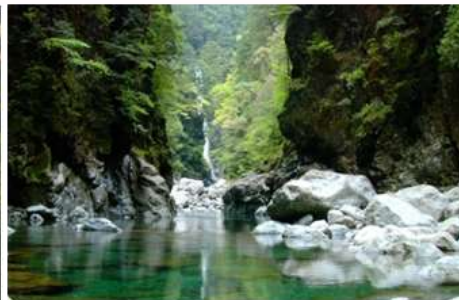
大台ヶ原・大峯山・大杉谷 (拡張登録)