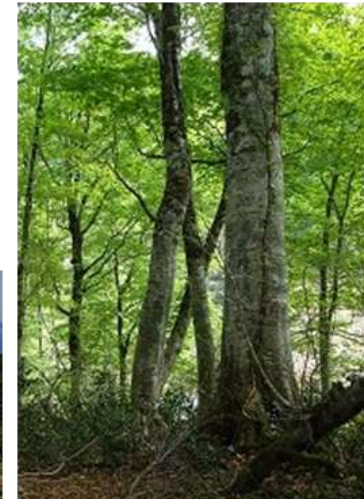
ブナ天然林