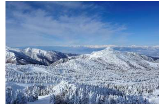
志賀高原