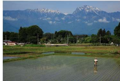
甲斐駒ヶ岳と水田(©南アルプス市)