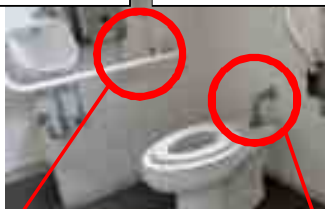
非常ボタンの位置