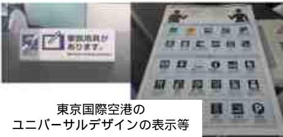
東京国際空港の ユニバーサルデザインの表示等