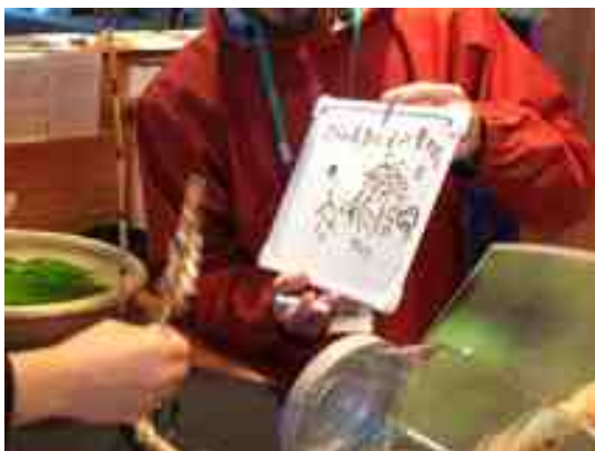
日光国立公園 那須平成の森フィールドセンター でのホワイトボードによる聴覚障 がい者への対応

環境省が所管する国立公園のビジターセンター等や国民公園の利用施設の管理者に対して、アンケート調査を実施。ユニバーサルデザインに関する取組状況を取りまとめた。