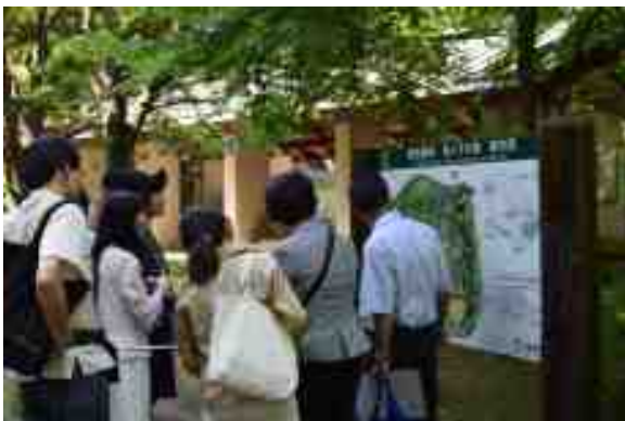
案内板を使った解説の様子