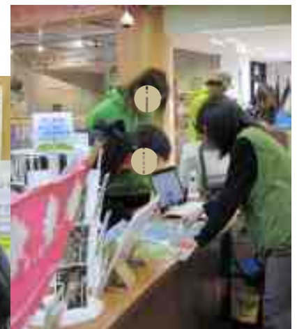
阿蘇くじゅう国立公園 長者原ビジターセンターでの外国人対応