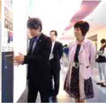
東京国際空港国際線ターミナルの視察