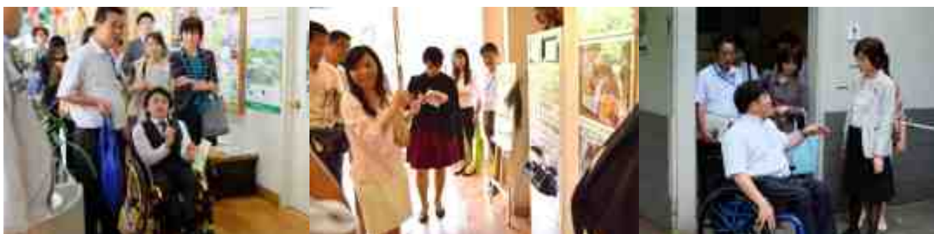
有識者との新宿御苑の視察