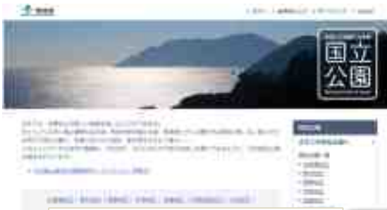
環境省 国立公園ホームページ