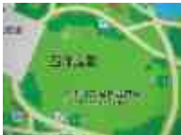
コントラストがない例

入口の標識等でトイレやバリアフリー設備がどこにあるか一目で分かるとよい。案内板の前などの立ち止まる位置は、フラットな地面としてほしい。図柄、文字と背景のコントラストがあまりない。樹名板などの文字が小さい。