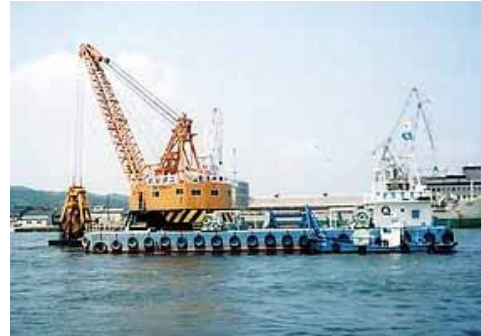
(グラブ浚渫：水深が大きい場合)