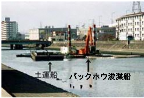
(バックホウ浚渫：水深が小さい場合)