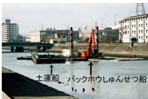
(バックホウ浚渫：水深が小さい場合)