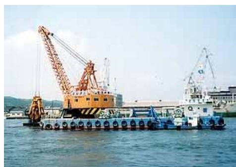
(グラブ浚渫：水深が大きい場合)