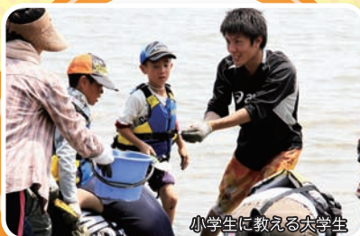
小学生に教える大学生