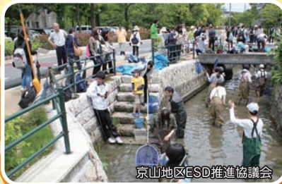
京山地区ESD推進協議会