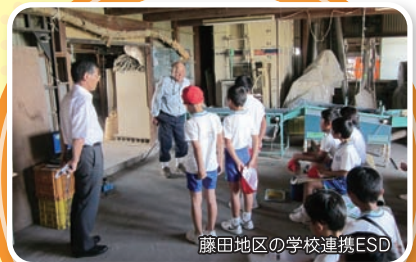
藤田地区の学校連携ESD