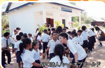
NPO法人ハートオブゴールド