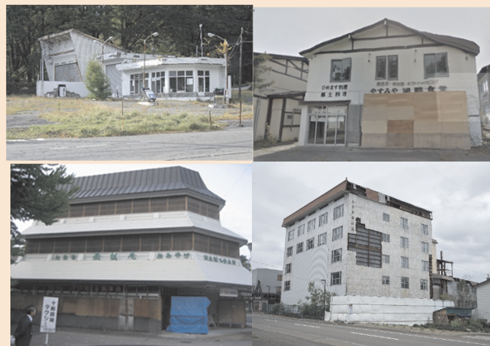
国立公園内の廃屋の例