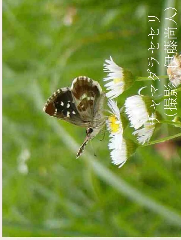
チャマダラセセリ

＊ 長野県は昨年この一部を、希少野生動植物条例に基づき、希少野生動植物生息地等保護区に指定した。チャマダラセセリの生息地であることを掲げたが、乱獲のおそれのある種については公表していない。