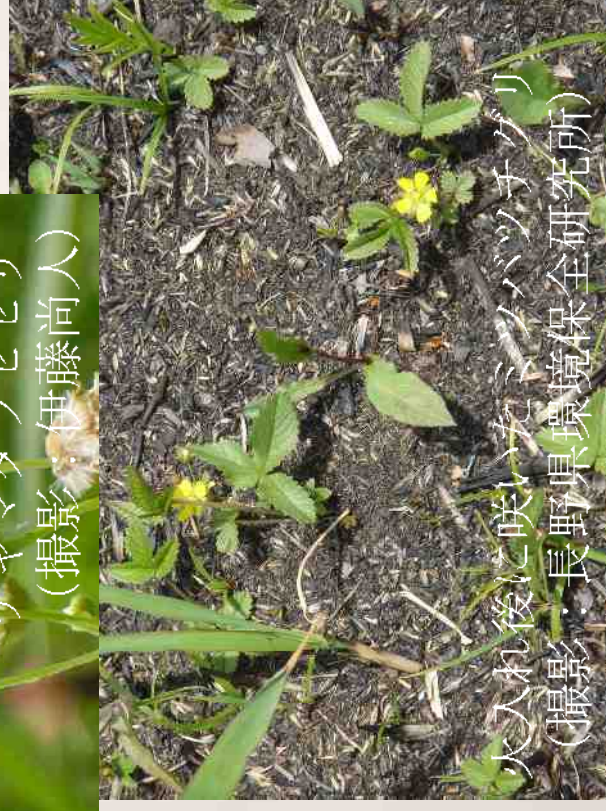
火入れ後に咲いたミツバツチグリー