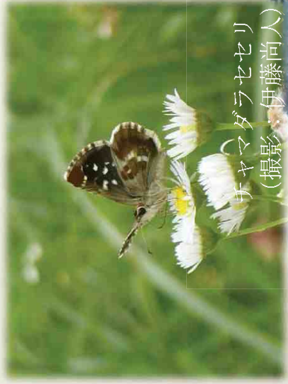
チャマダラセセリ

* 半自然草地は、火入れ・採草という集落の共同作業で維持されてきたので、伝統的草地管理そのものへの奨励措置（直接支払い等）の支援が求められる