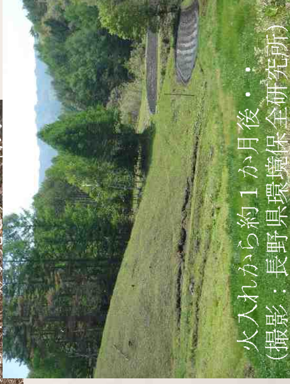
火入れから約1か月後・・・