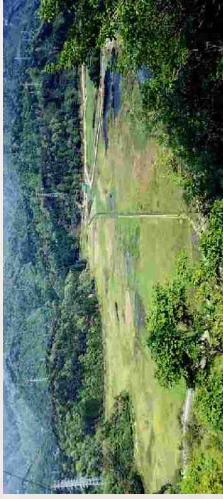
福井県敦賀市の中池見（ラムサール湿地）

* 2015年5月 環境事後調査委員会の結果を受けて再度ルート変更（しかし事後調査は工事完了で終了？）