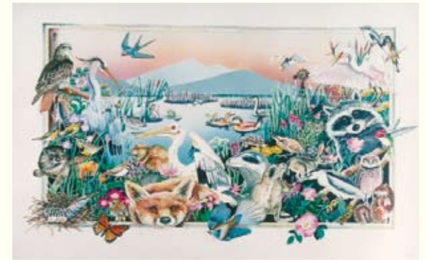
ダウ・ケミカル社の社有地のポスター

海外では、企業が社有地の一部を、積極的に野生の生きものの生育・生息地として提供している事例があります。これらの取り組みでは、自主的にその土地を社有地内における保護区として設定するなど、土地の確保が継続されるような手法がとられているものもあります。また、社員有志を中心に運営チームが結成され、土地の維持管理や環境教育プログラムの運営をおこなっています。