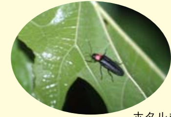
ホタルも地域によって遺伝子が異なります

もともと日本に存在しなかった外来種や、園芸種などの動植物の導入は、地域の生態系のしくみに悪影響を及ぼしてしまうおそれがあります。特に「緑化」の際には、本来その地域の自然に生育している樹木や野草を選定することが大切です。