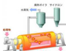
炭素繊維強化プラリサイクル設備