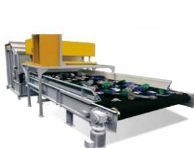
廃プラの選別設備