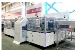
太陽光パネルリサイクル設備