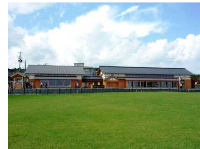
公園編入地域（青森県）の 集団施設地区整備 （種差海岸 インフォメーションセンター）