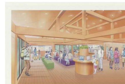
トレイルセンター （整備イメージ）