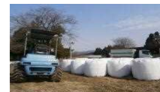
農林業系廃棄物（稲わら、牧草等）