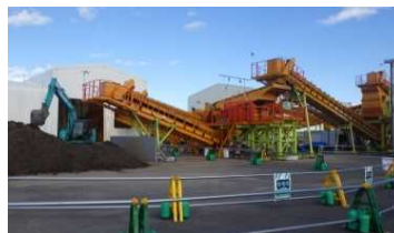
檜葉町の仮置場内破碎選別設備