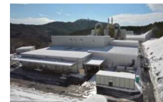
飯館村蕨平地区 仮設焼却施設