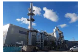
檜葉町の仮設焼却施設