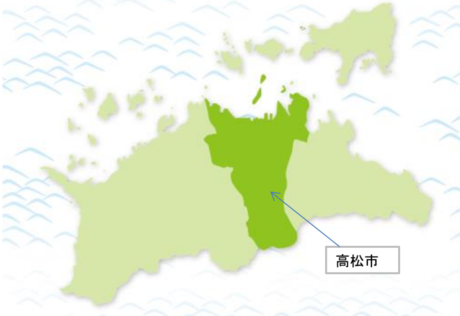
【図2】香川県における高松市の位置