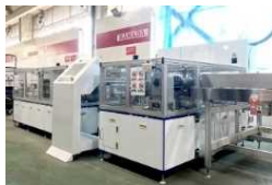
太陽光パネルリサイクル設備