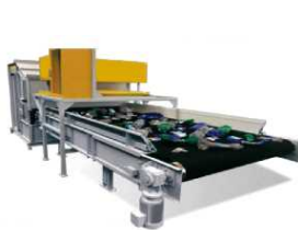
廃プラの選別設備