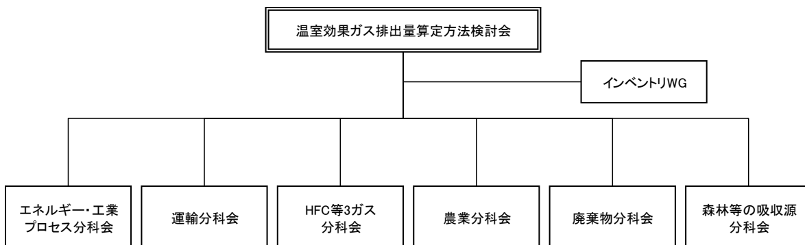
図 A 6-1 温室効果ガス排出量算定方法検討会の体制

インベントリWG及び各分科会は、各分野の専門家より構成され、インベントリ改善に関する案を検討する。改善案は、温室効果ガス排出量算定方法検討会において再度検討され、承認される。