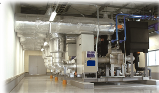
＜冷凍冷蔵倉庫への導入イメージ＞