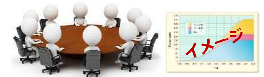
浮体式洋上風力発電の早期普及に向けた検討