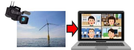
既存の浮体式洋上風車を用いた理解醸成