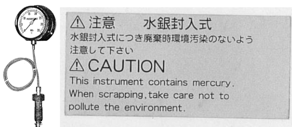
(写真) 高温用ダイヤフラムシール圧力計と注意銘板の例