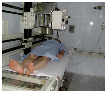
ホールボディカウンタ